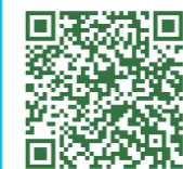
Bus Time Schedule 巴士時刻表