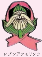
レブンアツモリソウ

2011年から続くこのプロジェクトは、バッジの購入を通じて、園路の維持・補修などの活動を支援する取り組みです。バッジの第1号は島にしか咲かないレブンアツモリソウで、この他に毎年1つずつ新しい花のデザインのバッジが作られています。